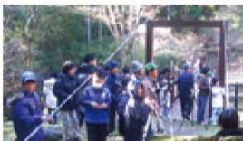
バードウォッチング

鳥の声に耳を澄ませ、図鑑片手にバード・野草ウォッチング。また、花々や周囲に広がる愛鷹山系に心奪われながらのハイキングや川登りは、自分を取り戻す一日を約束してくれるはず。